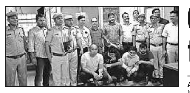
Some of the accused who have been arrested.